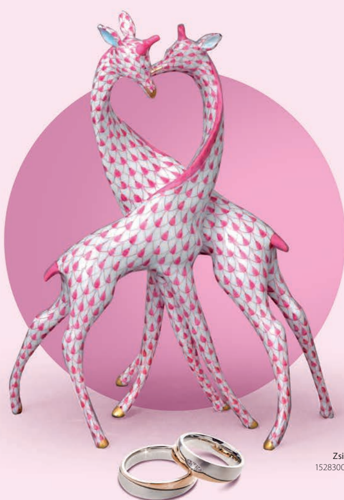
Zsiráf pár 15283000 VHP

Átlagosan évi tízmillió menyegzőt tartanak Kínában, de meglepően magas számokkal találkozunk akkor is, ha sorra vesszük a kínai esküvői tradíciókat. Például a lakodalomban nem ritka, hogy tízfogásos vacsorát szolgálnak fel – a bőség és a sokasodás reményében –, a menyasszony pedig – a jólét szimbólumaként – akár harminc, de legalább három különböző ruhakölteményben pompázhat.