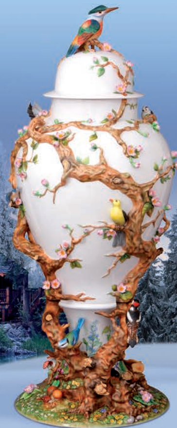
Váza plasztikus díszítéssel 06565091 SP2010-MCD