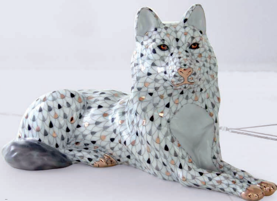
Fekvő farkas 05801000 SVH4COL-1

A szánhúzás leginkább a futóversenyekhez hasonlítható, a cél a táv minél gyorsabb teljesítése. Vannak néhány kilométeres, rövidtávú versenyek, és extrém hosszúságú, több napon át tartó futamok is. Egy kutyafalkát általában 16 kutya alkot, amelyek 30 km/h átlagsebességgel képesek siklani a havon. Ez az igen gyors tempó azért is lehetséges, mert a szán és a hajtó össztömege nem éri el a száz kilót. A hajtónak nagyon jól kell ismernie a kutyákat ahhoz, hogy el tudja dönteni, melyikük milyen szerepet kapjon. A jó állóképességűek kerülnek a szánhoz legközelebb, hiszen ők jól tudnak terhet mozgatni, míg vezérkutyának a falka leggyorsabb tagját kell kinevezni, elvégre ő fogja diktálni a tempót.